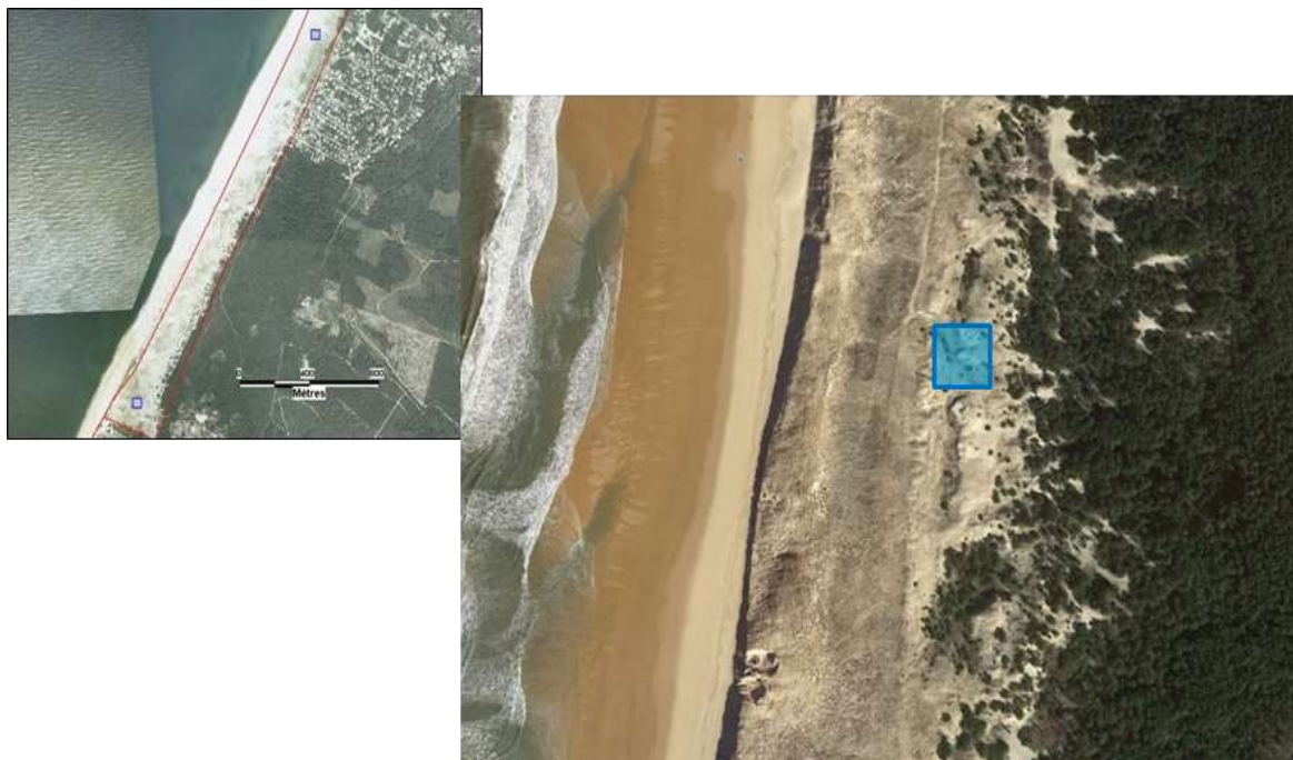
Fig. 11. Exemple disposition des placettes littorales (Lézard ocellé)